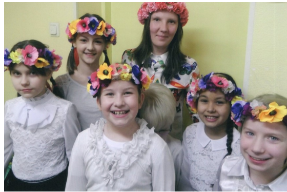
Bērni gatavojās tautas dējam.

Esam arī saņēmusi pateicību no Talsas draudzes kā arī no Rīgas Vecās Svētā Ger- trudes draudzes , kuras arī katru gadu atbal- stam ar ziedojumiem.