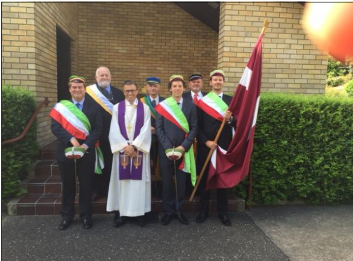
Kalpaka piemiņas dievkalpojums