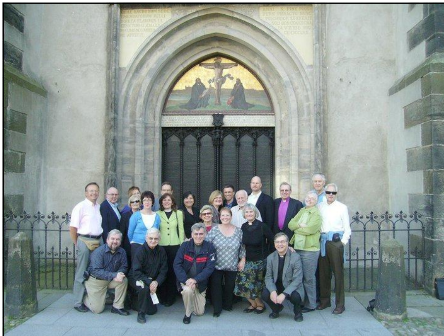
Baznīcas Virsvaldes plenārsēdes dalībnieki pie Vitenbergas pils baznīcas durvim.

Daudz ko citu var saredzēt gleznā, bet šis rakstiņš domāts lai iepazīstinātu ar tā laika bagātību, kas vēl šodien redzama.