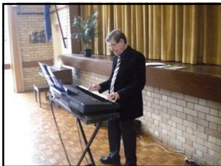
Imants iepriecina ar mūziku