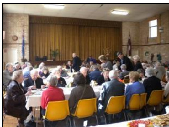
Dārza svētku dalībnieki