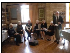
Priekšnieks ziņo par labiem rezultātiem