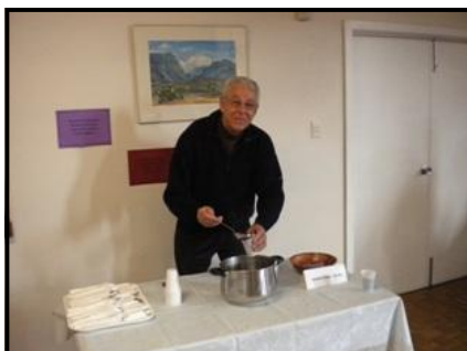
Ivars dala karst vīnu!