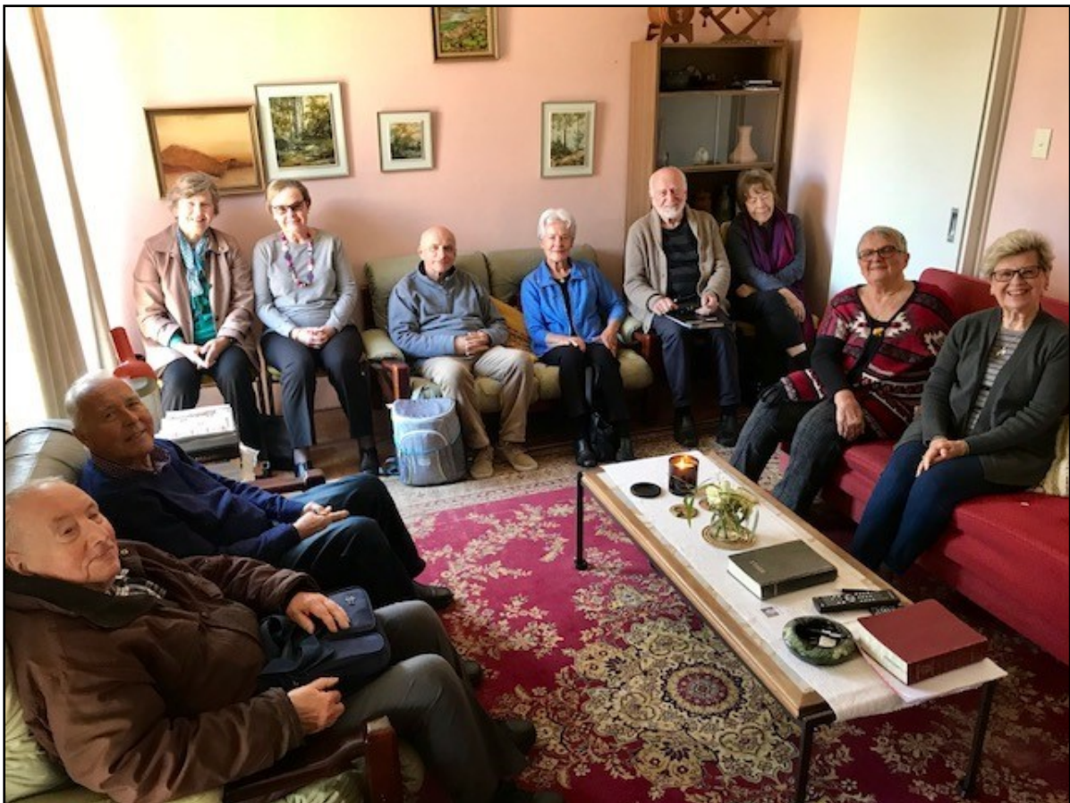
Bībeles stundas dalībnieki.

May God help us to see and understand this truth and to trust in Him fully. Amen.