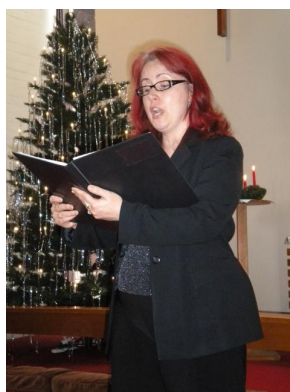
Tāra dzied baznīcā