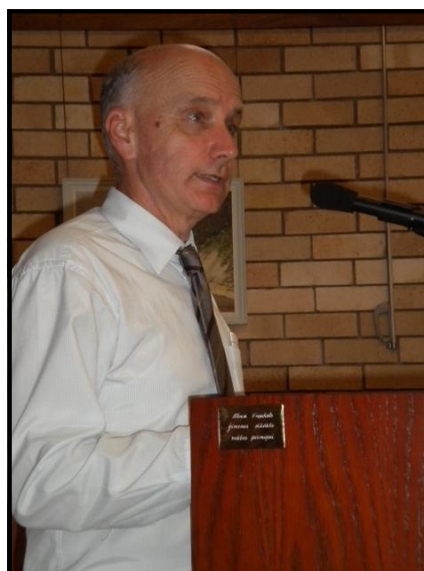
Draudzes sekretārs lasa protokolu pilnsapulcē